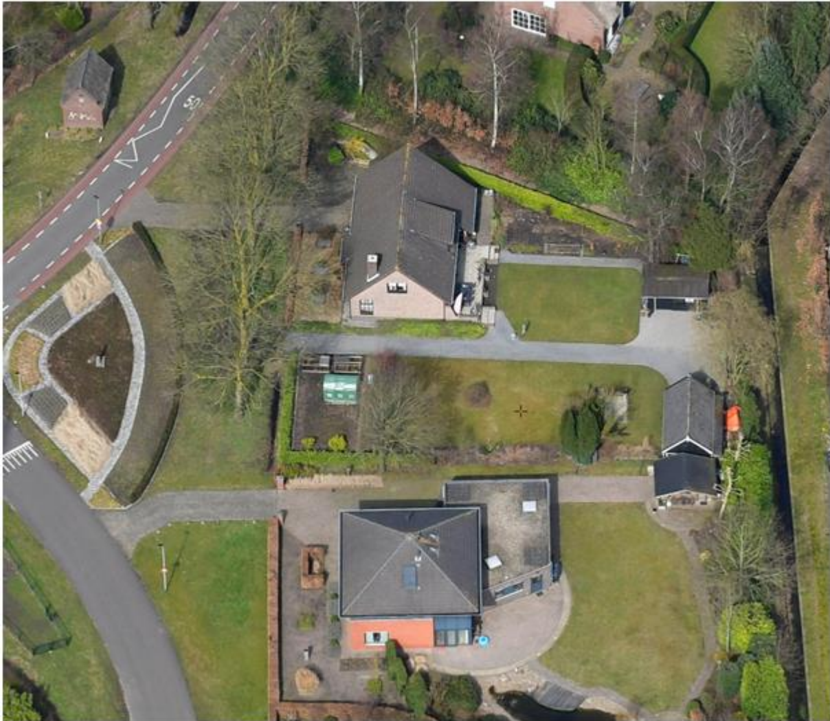
Luchtfoto Haansberg 28A

De eigenaren van Haansberg 28A willen op het perceel Haansberg ongenummerd, kadastraal bekend K 2888, gebruik maken van de mogelijkheid om een woning te bouwen (eigenaren worden verder aangeduid als verzoekers). Het braakliggende perceel heeft de bestemming wonen maar zonder bouwvlak. Voor deze locatie is in het bestemmingsplan 'Sander-Banken' een wijzigingsbevoegdheid (artikel 26.5) opgenomen om een bouwvlak toe te voegen en zo de bouw van een vrijstaande woning mogelijk te maken.