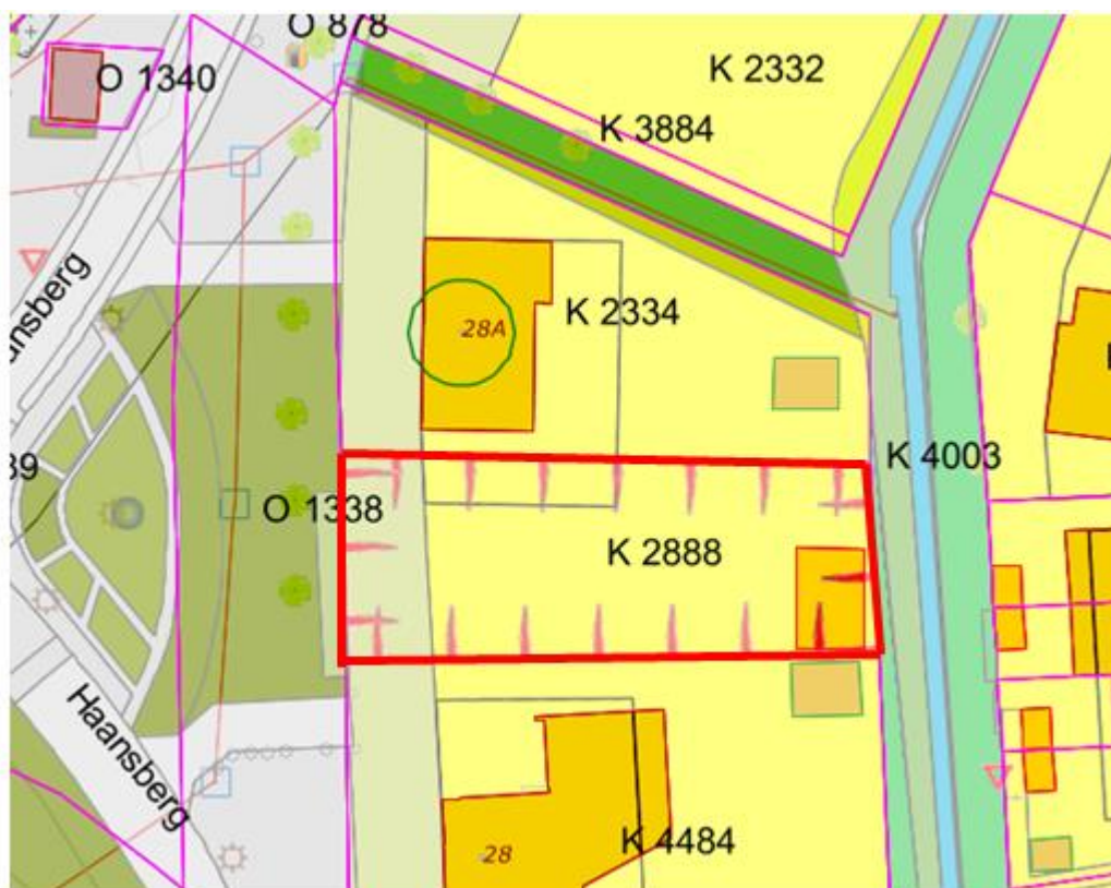
Uitsnede bestemmingsplan Sander-Banken (2013)

De gronden zijn gelegen in het bestemmingsplan 'Sander-Banken' (vastgesteld d.d. 11 juni 2013). De gronden hebben de bestemming 'Wonen - Vrijstaand' en 'Tuin'. Het perceel is gelegen aan de rand van de wijk Sander Banken tegen het buitengebied van Etten-Leur aan. In de planregels is in artikel 26.5 een wijzigingsbevoegdheid voor het college van burgemeester en wethouders opgenomen om binnen de gebiedsaanduiding 'Wro-zone - wijzigingsgebied 2' een bouwvlak toe te kennen ten behoeve van de bouw van één vrijstaande woning. De wijzigingsregeling bevat een aantal voorwaarden waaraan voldaan moet worden waaronder de grootte van het toekomstig bouwvlak, de maximale goot- en bouwhoogte en parkeervoorziening. Daarnaast dient als onderdeel van het wijzigingsbesluit verantwoording gegeven te worden over overige ruimtelijke aspecten zoals de bodemkwaliteit, milieuzonering, archeologie, water, geluid, lucht, verkeersveiligheid, ecologie (flora en fauna) en economische uitvoerbaarheid.