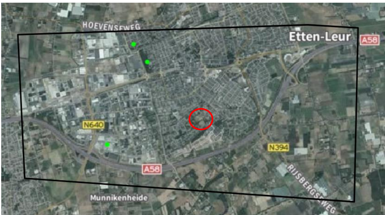
Figuur 2: Waarnemingen van gevalideerde bosuilen, NDFF periode 2010 – 2020. Rode cirkel is plangebied.