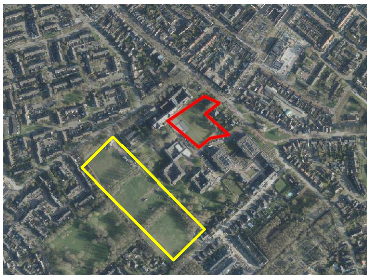
Figuur 1: Ligging plangebied Withof complex (rood) en Kloostervelden (geel).

In juni 2020 is een vraag van derden bij de gemeente binnen gekomen. De vraag was waarom de bosuil niet is meegenomen of genoemd wordt in de natuurtoetsen. Dit terwijl de bosuil toch een beschermde vogelsoort is?