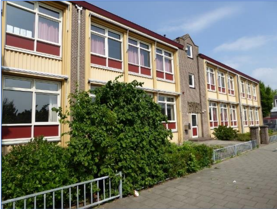
Figuur 05: de Vier Heemskinderen (voorzijde)

In het projectgebied ligt een school, een speelplaats en een fietsenhok.