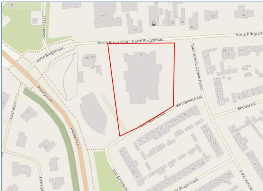
Figuur 1: projectgebied (rood omkaderd) met school het Kompas.

De projectgebieden omvatten een tweetal deelgebieden met in ieder een school (deelgebieden zijn rood omkaderd):