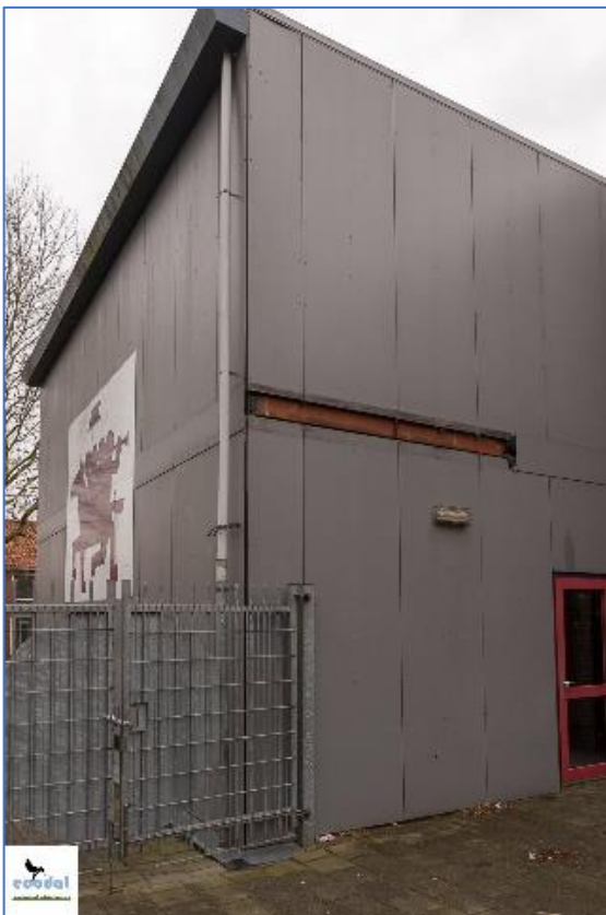
Figuur 06: de Vier Heemskinderen(aanbouw)