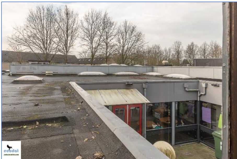
Figuur 04: Het Kompas (binnenplaats)