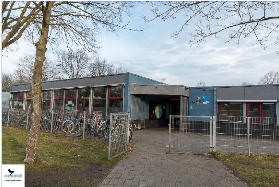
Figuur 03: Het Kompas (voorzijde)

In het projectgebied ligt een school, een speelplaats, een fietsenhok en een binnenplaats.