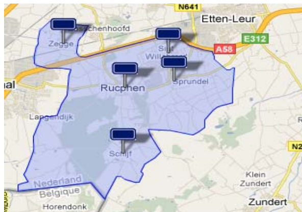
Kaart gemeente Rucphen

Het industrieterrein Nijverhei ligt centraal tussen de kernen Rucphen, Sprundel en Sint Willebrord. Op dit industrieterrein zijn ongeveer 130 bedrijven gevestigd.