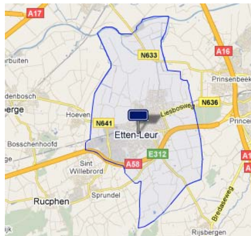
Kaart gemeente Etten-Leur

In 2009 is de polikliniek van het Franciscus ziekenhuis geopend. In Etten-Leur zijn ruim 2.000 bedrijven gevestigd. Daarnaast zijn er in de gemeente twee middelbare scholen (de KSE en het Munnikenheide College) en een aantal basisscholen gevestigd die verspreid zijn over de gemeente.