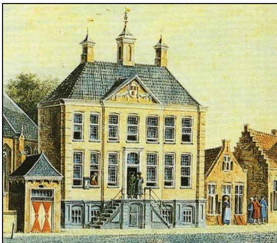
Het raadhuis in 1778 (D. Verrijk)

Op 20 november 1775 vond de aanbesteding plaats. De bouw werd voor 11.200 gulden gegund aan Willem Burgers. Voor de financiering werd een lening van 6.000 gulden afgesloten, de rest werd uit de reserves betaald. Voor de bouw werden materialen van het gesloopte dorps huis gebruikt zoals dakpannen en stenen. Ook het oude klokje moest naar het nieuwe raadhuis worden overgebracht. Op 1 januari 1776 werd met het werk begonnen en volgens het bestek moest het gebouw op 1 oktober 1776 worden opgeleverd. Gedurende de sloop van het oude dorps huis en het gereedkomen van het nieuwe vonden de secretariaatswerkzaamheden bij de secretaris plaats. Hij ontving hiervoor dertig ducaten. Voor de conciërge werd tijdelijk een woning gehuurd. In de loop der tijd is de buitenzijde van het raadhuis weinig veranderd. In 1830 werden de oorspronkelijke ramen vervangen door zesdelige schuiframen. Ook werd het torentje voorzien van een uurwerk. Na de ingebruikname van het nieuwe stadskantoor in 2004 doet het oude raadhuis dienst als vergadercentrum.