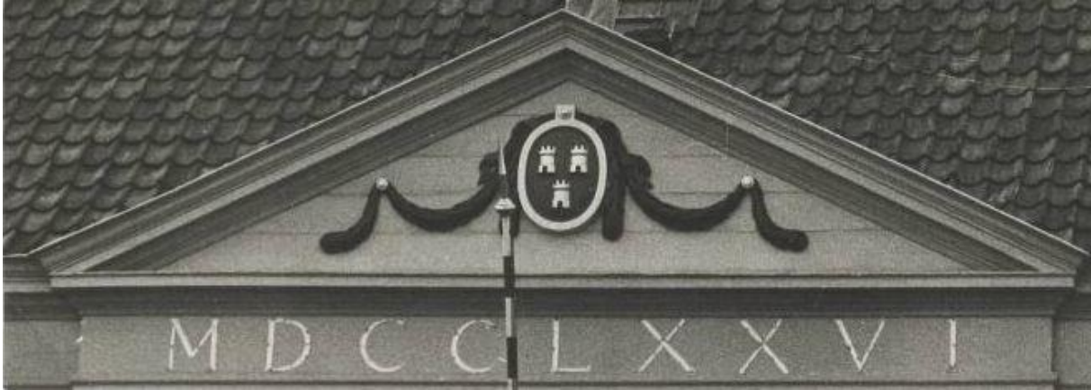
Het fronton met daarin het gemeentewapen en daaronder in het fries het jaartal 1776

van het hoofdgestel daaronder het jaartal MDCCLXXVI (1776). Het gebouw wordt bekroond door twee van tentdakjes voorziene hoekschoorstenen en in het midden een houten dakruiter met koepeltje. De oorspronkelijke ramen zijn omstreeks 1830 vervangen door zesdelige schuiframen. Gerestaureerd in 1963”.