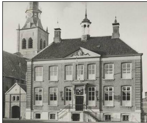
Het raadhuis ca. 1960